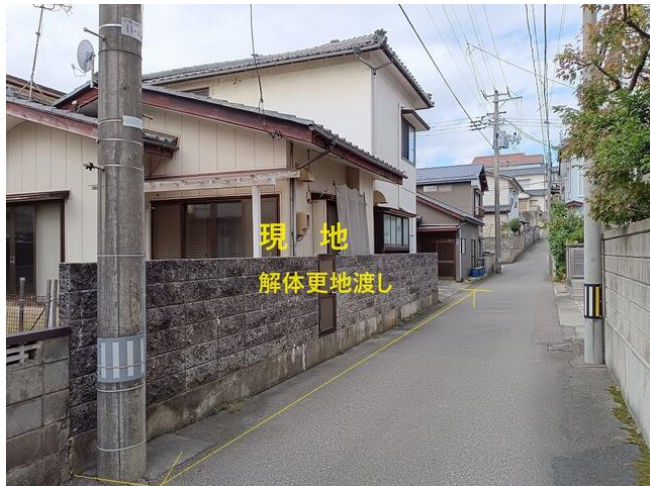
現地 解体更地渡し